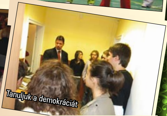
Tanuljuk a demokráciát