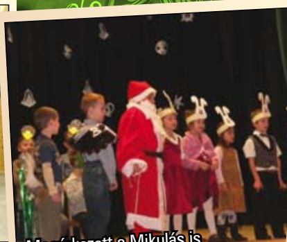
Megérkezett a Mikulás is