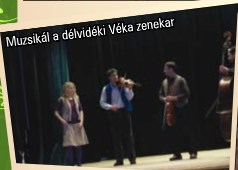
Muzsikál a délvidéki Véka zenekar