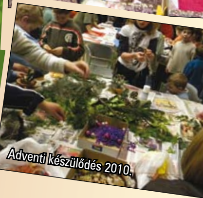
Adventi készülődés 2010.