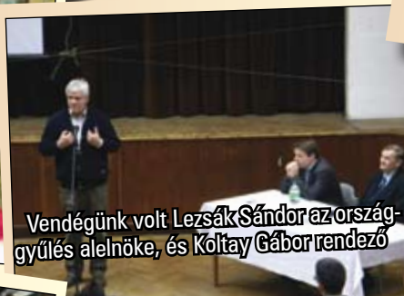
Vendégünk volt Lezsák Sándor az országgyűlés alelnöke, és Koltay Gábor rendező