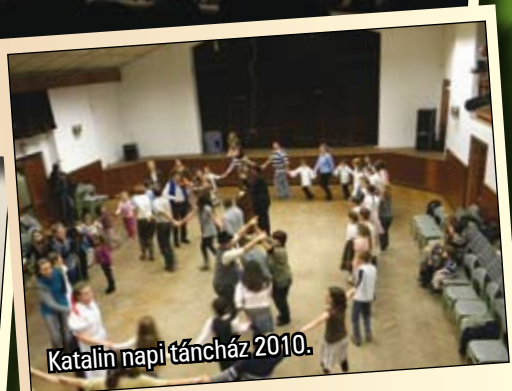
Katalin napi táncház 2010.

További képek elérhetőek a www.kultura.zsombo.hu weboldal galériájában