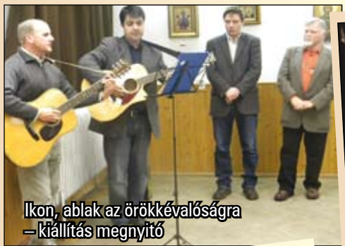
Ikon, ablak az örökkévalóságra – kiállítás megnyitó