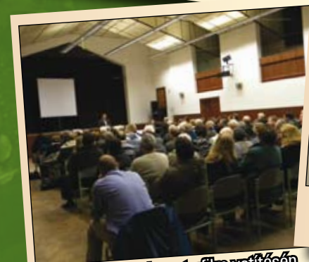
Teltház a Mindszenty film vetítésén