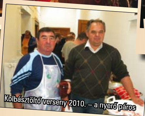
Kölbásztöltő verseny 2010. – a nyerő páros