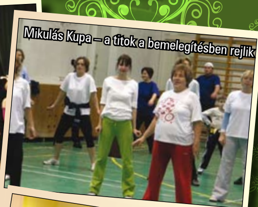
Mikulás Kupa – a titok a bemelegítésben rejlik