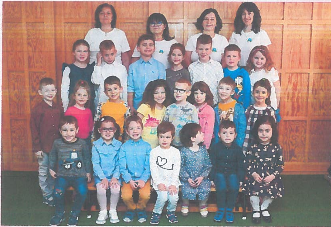
Nefelejcs Katolikus Óvoda 2022