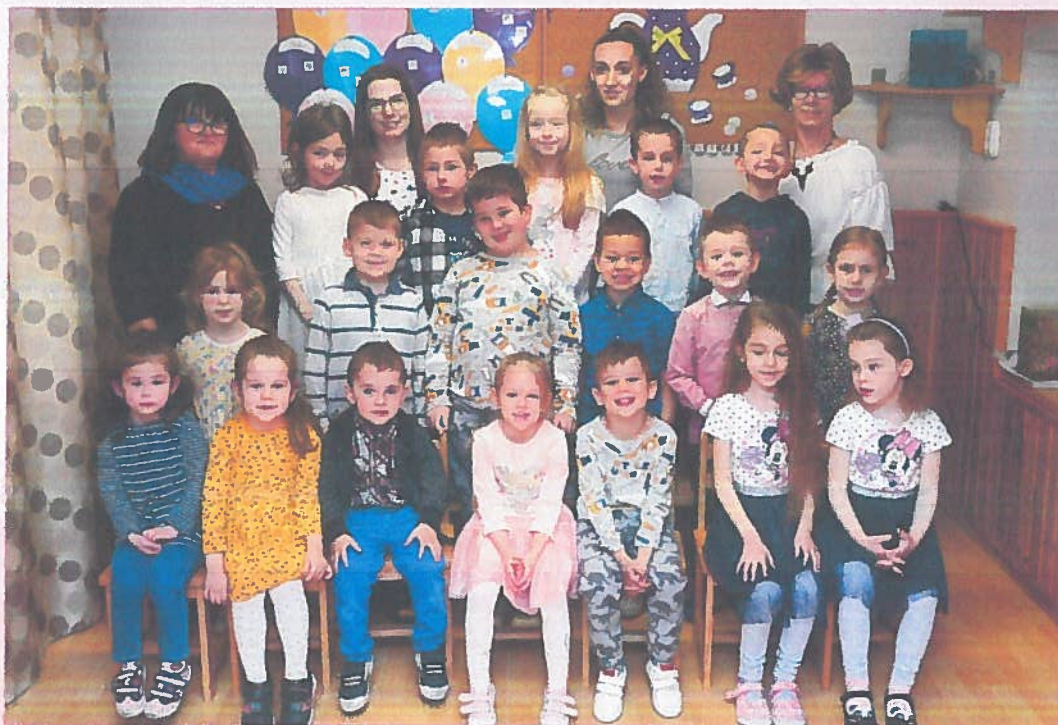
Nefelejcs Katolikus Óvoda 2022