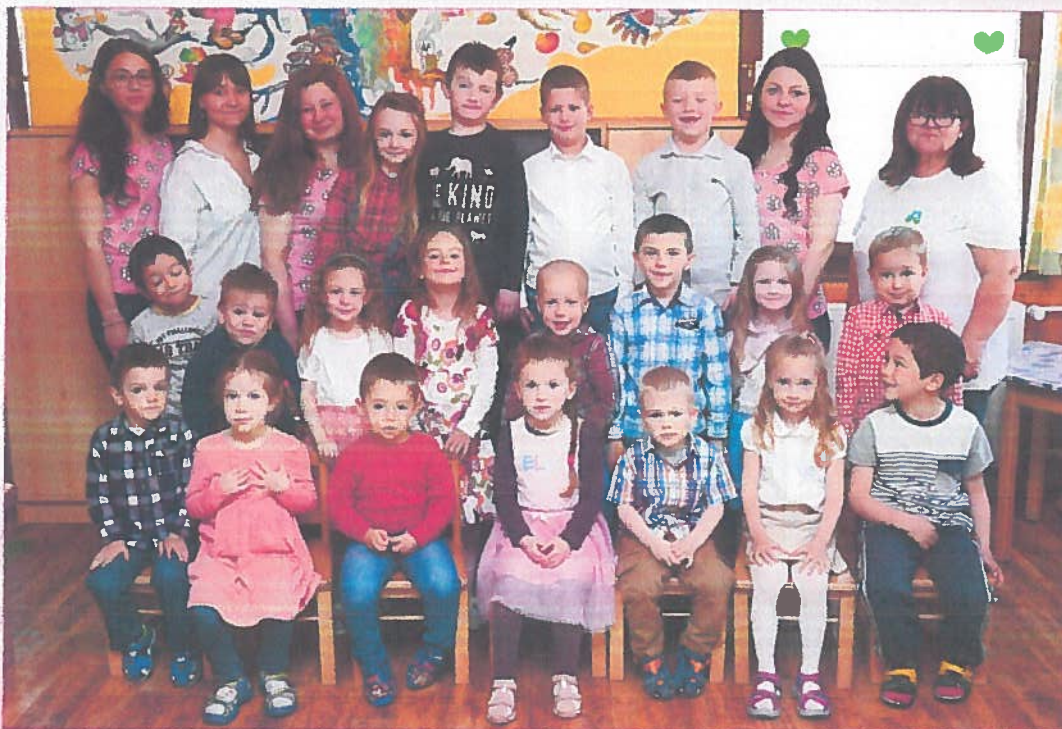
Nefelejcs Katolikus Óvoda 2022