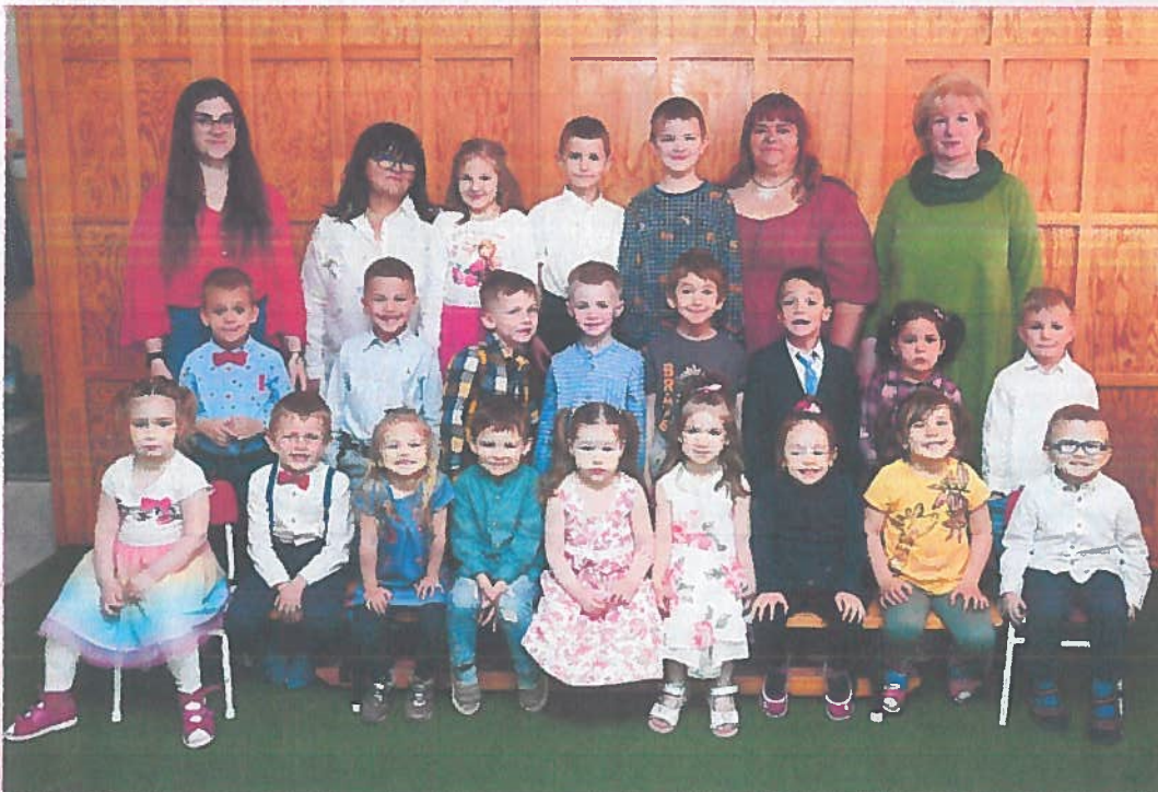
Nefelejcs Katolikus Óvoda 2022