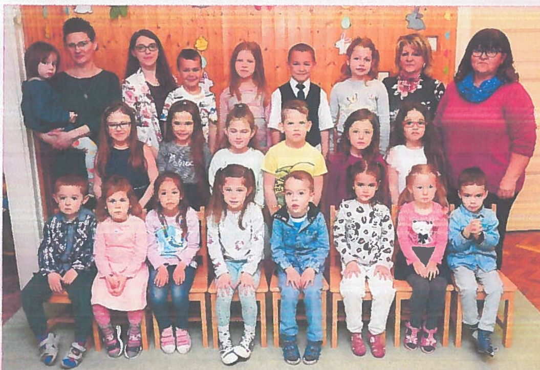
Nefelejcs Katolikus Óvoda 2022