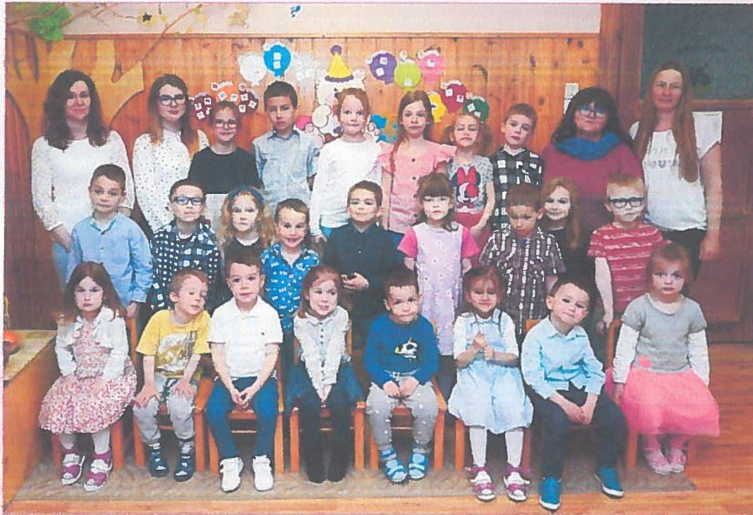
Nefelejcs Katolikus Óvoda 2022