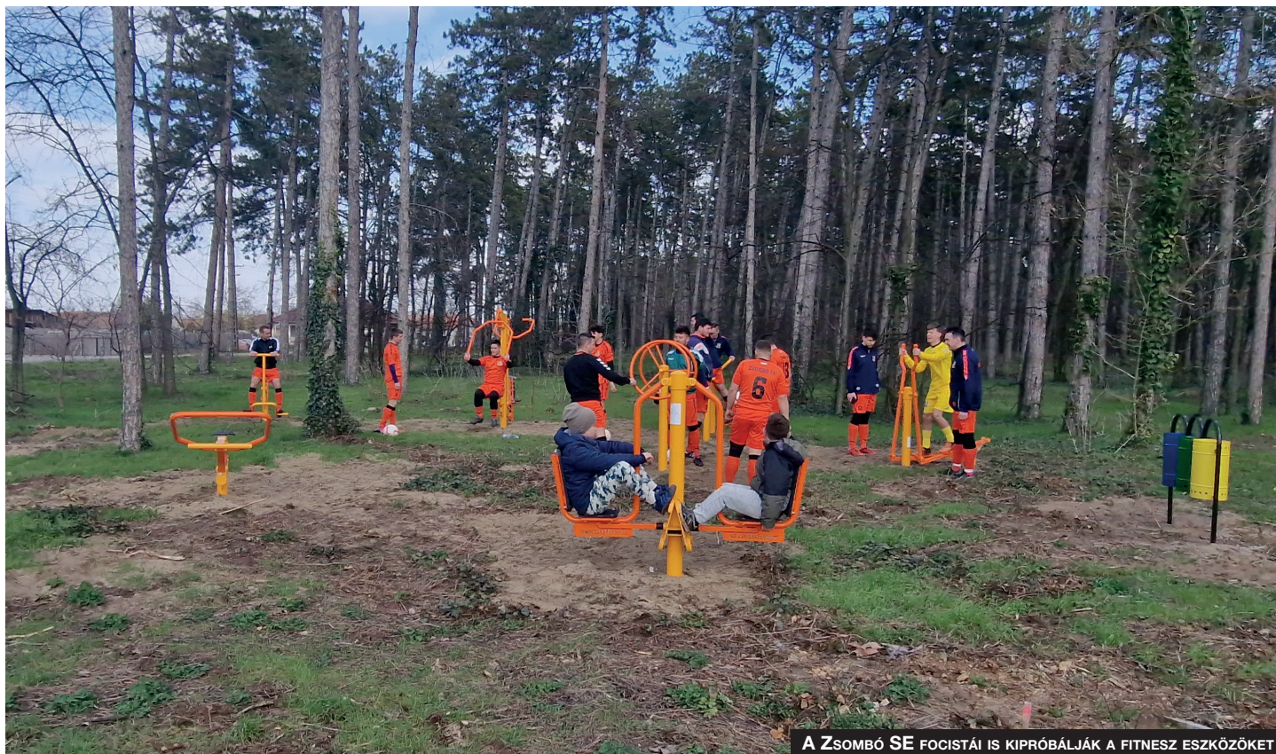
A ZSOMBÓ SE FOCISTÁI IS KIPRÓBÁLJÁK A FITNESZ ESZKÖZÖKET